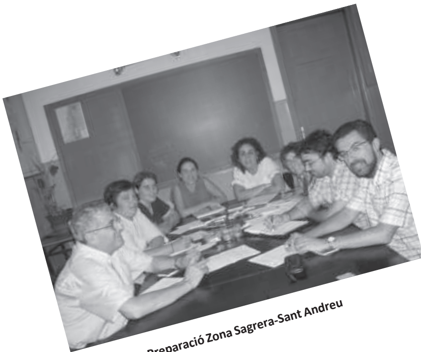
Preparació Zona Sagrera-Sant Andreu

No deixis caure el braç car el dia s'alça. No deixis el combat per un món millor.