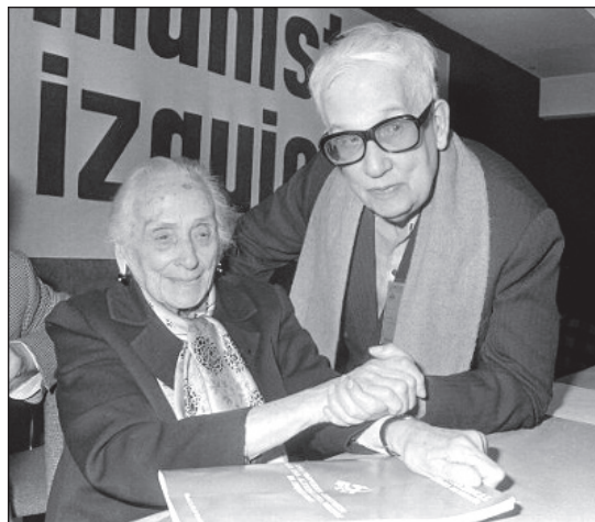
Llanos se situó entre los no creyentes y también los anticlericales y militó en el PCE (fue amigo de Dolores Ibárruri) y en el sindicato CC.OO.

optar por encarnarse en el fango de los desheredados y allí permaneció hasta su fallecimiento, en 1992», anota Delgado.