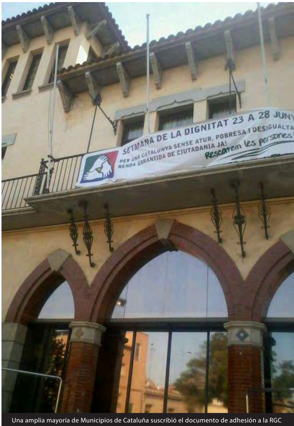
Una amplia mayoría de Municipios de Cataluña suscribió el documento de adhesión a la RGC