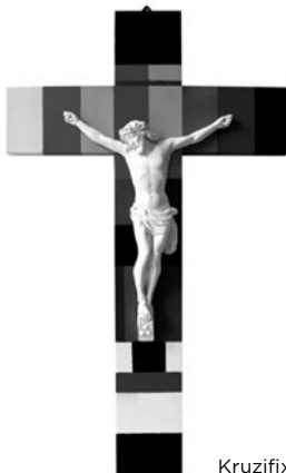
Kruzifix (Stefan Strumbel)

El Jesús de la Història, el Crist de la Fe. Aquesta tensió és sempre present entre les persones creients. En aquest Creixem n. 1 que us presentem, posem l'accent en confrontar les nostres pors per seguir Jesús amb llibertat.