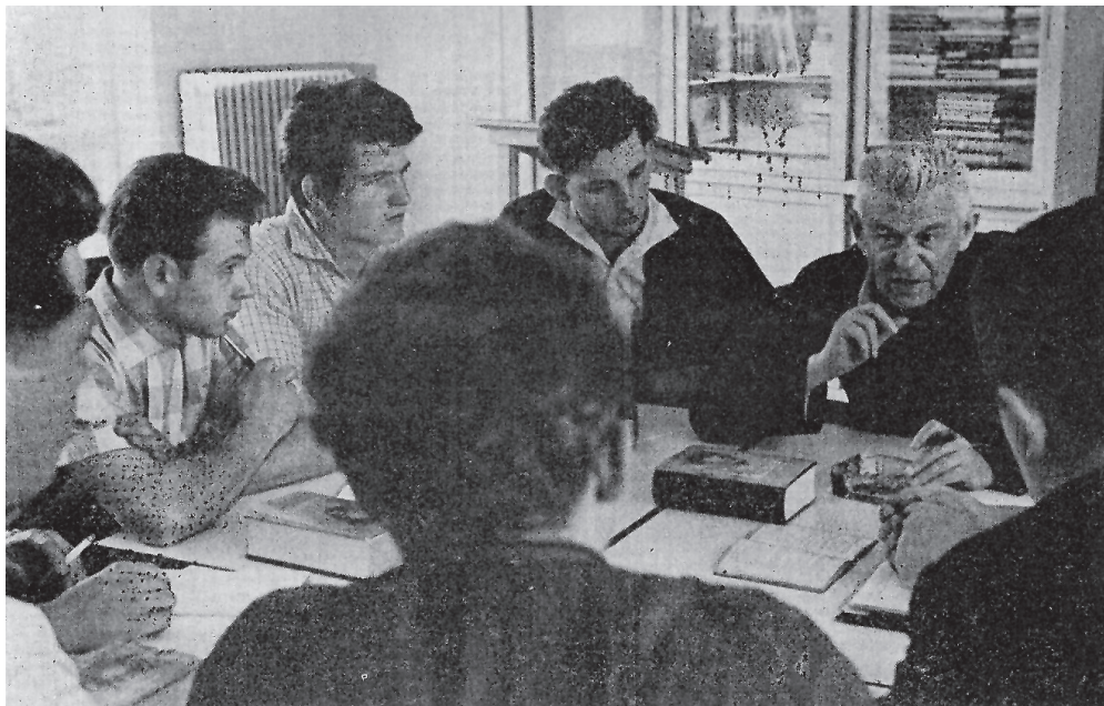
Tant la JOC com l'ACO han aconseguit avenços decisius pel que fa a la redempció catòlica del món obrer.

protagonistes de la seva història i apòstols per dur el missatge de Jesús als seus companys va ser el que el va impulsar a promoure la JOC, que ell concebia com un moviment d'Acció Catòlica Obrera en el si de l'Església.