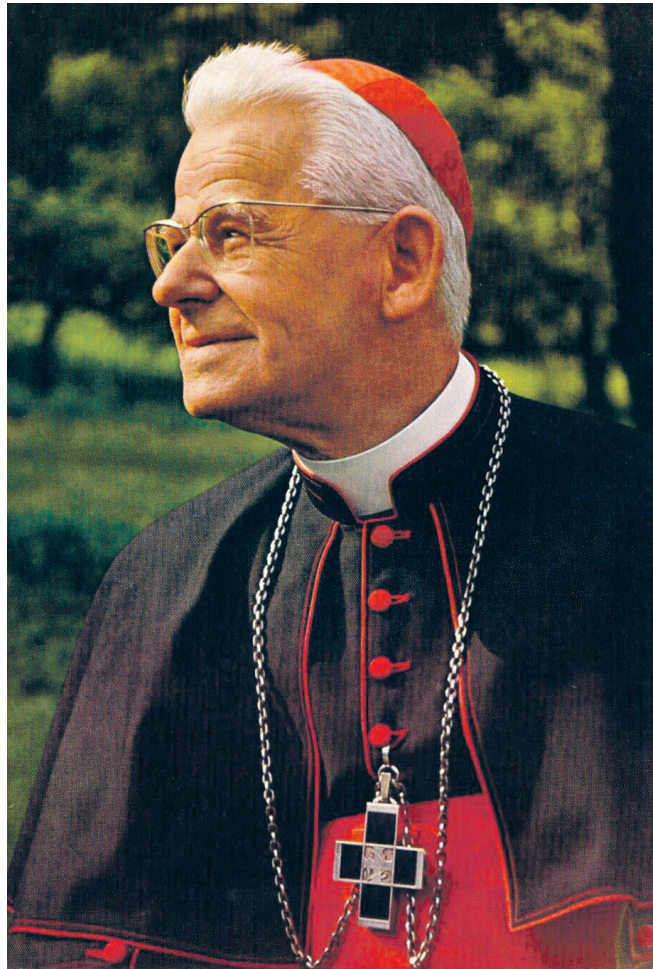
Cardijn va dotar la JOC amb el mètode de la Revisió de Vida Obrera (Veure, Jutjar i Actuar) el punt de partida essencial del qual és la vida.

El 1922 es llança la primera gran enquesta «L'adolescència assalariada», de la qual naixerà part del programa general de la JOC. L'any següent mor la mare de Cardijn. Ell durà el seu record fins a l'últim racó de la terra