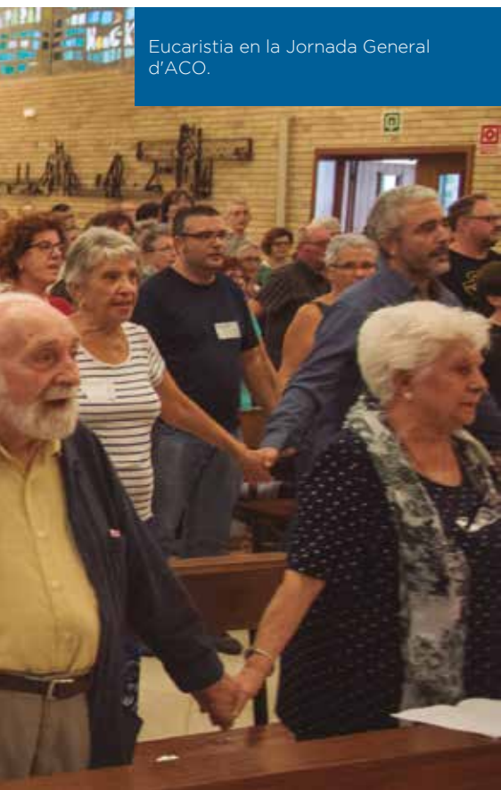
Eucaristia en la Jornada General d'ACO.

Viu a Viladecans, és membre de l'ACO, militant dels Comuns i participa en una llista inacabable d'activitats polítiques, socials i religioses. Jubilada de fa poc. «Treballar s'ha convertit en la manera de relacionar-me amb d'altra gent. Potser no l'única manera, però sí la més freqüent. Ara que ja em plantejo la jubilació potser serà el moment de passar del treball al ball. Bé, és un dir, perquè encara que el treball formal s'acabi, i jo vull que s'acabi, hi ha moltes altres coses en què continuaré treballant: gaudir de la música, de la natura, de la bellesa, de la conversa, de l'escriure. "Perdre el temps", disfrutar d'allò que aparentment no serveix per a res, però que notes que surt amb força de dins o que connecta amb l'interior i que t'uneix a l'altra gent. I això, però, té molt també de treball, d'esforç, d'incomodat, de tensió