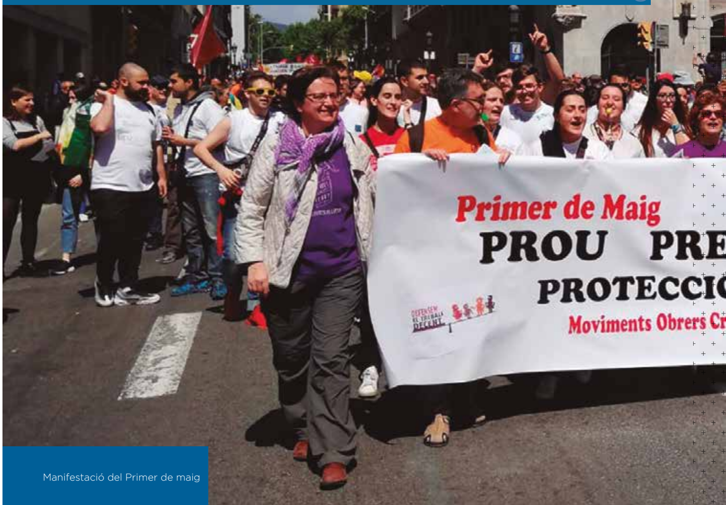
Manifestació del Primer de maig