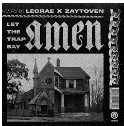
Portada del disc de Lecrae, "Let the trap say Amen"

«M'he adonat que soc molt espiritual. Avui dia no es parla tant d'això pel prejudici de vincular el que és religiós amb les institucions, però per a mi no hi té res a veure. El que és espiritual té a veure amb alguna cosa que et transcendeix», afirmava la cantant Rosalía en una entrevista. El 20 de març passat, just la setmana que començava el confinament, penjava un tuit amb el parenostre, que va tenir més de 37.000 M'agrada .