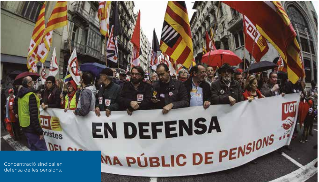
Concentració sindical en defensa de les pensions.

mare i marit. Ja a la maduresa, juntament amb altres dones que tenen familiars amb Alzheimer creen l'associació. Reconeix que ha dedicat la vida a treballar, a cuidar els altres i a fer l'associació per tal que se'n beneficiï molta gent.