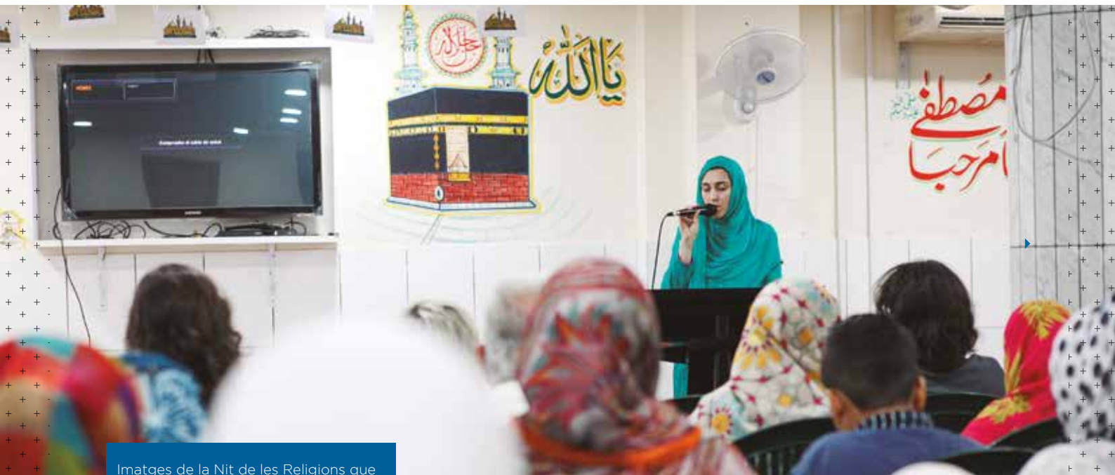
Imatges de la Nit de les Religions que organitza Audir Jove a Barcelona.

«Vosaltres sou l'ara de Déu». Una acció pastoral amb joves, o amb qui sigui, no serà bona si no es mira la gent com a protagonistes del moment present, com a subjectes, com a fills i filles de Déu, que els estima sense límits.