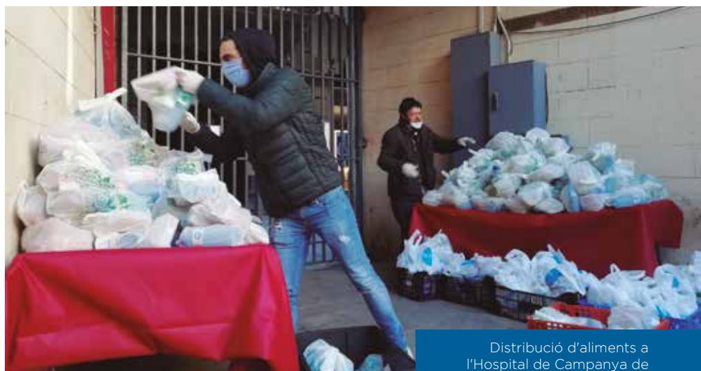
Distribució d'aliments a l'Hospital de Campanya de Santa Anna.

La irrupció del coronavirus també ha fet que el projecte Llum de Nit s'hagi de replantejar. Abans de la