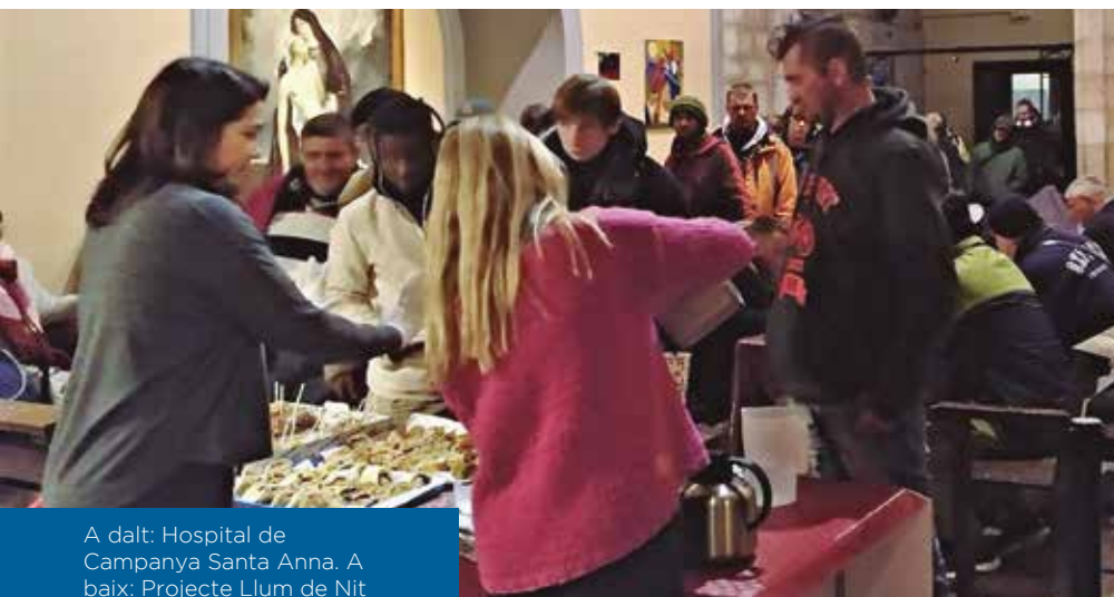
A dalt: Hospital de Campanya de Santa Anna. A baix: Projecte Llum de Nit a l'Església evangèlica de Gràcia.