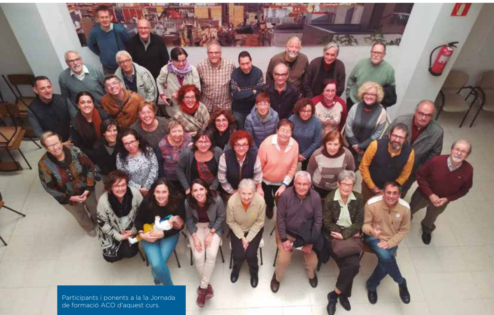
Participants i ponents a la 1a Jornada de formació ACO d'aquest curs.