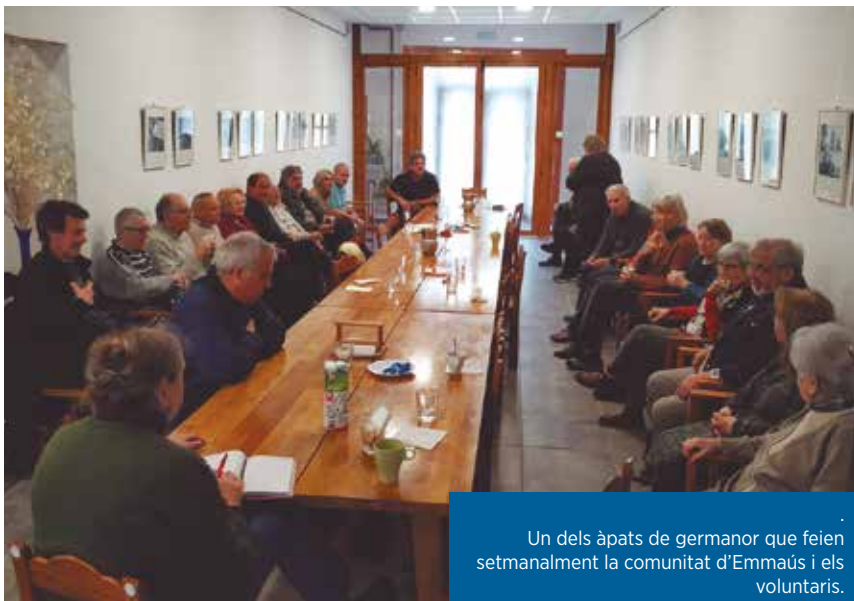
Un dels àpats de germanor que feien setmanalment la comunitat d'Emmaús i els voluntaris.