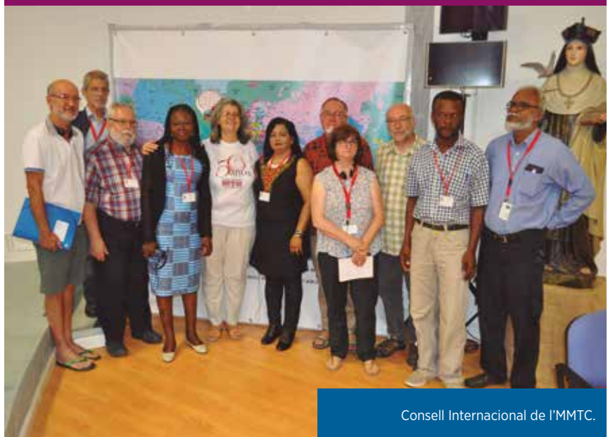
Consell Internacional de l'MMTC.

En la seva tasca de sensibilització, l'MMTC proposa quatre dies assenyalats a l'any per fer-se present en els moviments nacionals que l'integren: el 8 de març, Dia de la Dona Treballadora; el 1r de Maig; el 7 d'octubre, Dia del Treball Digne; i el 18 de desembre, Dia Internacional del Migrant. En el Pla de curs de l'ACO hi ha quatre Revisions de Vida proposades per l'MMTC per fer en els grups: Coronavirus, presenciant un «vivint junts»; Coronavirus..., indicatiu de la nostra salut!; Coronavirus..., complement injustícia social!; Coronavirus..., «oportunitat» per al nostre futur?