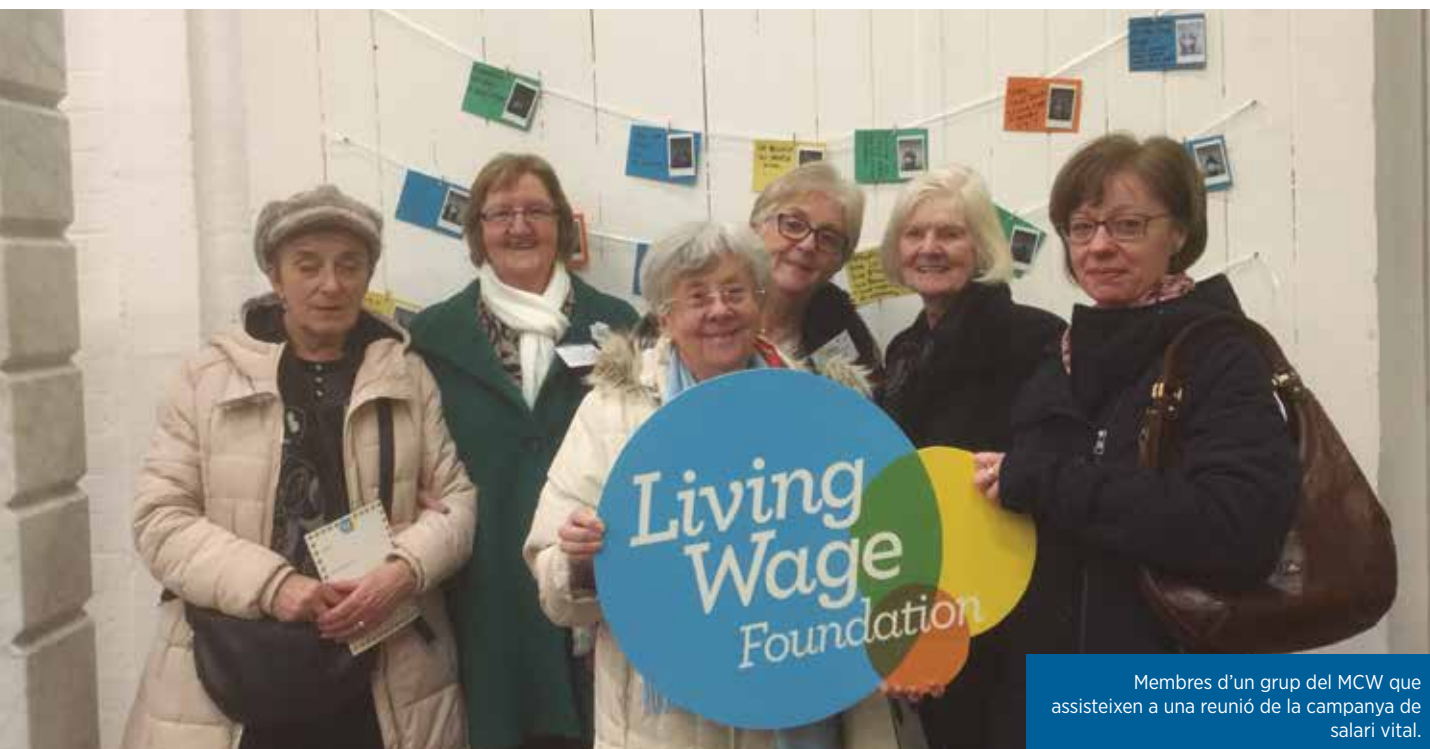
Membres d'un grup del MCW que assisteixen a una reunió de la campanya de salari vital.

continuarà havent-hi una altra crisi en la prestació d'assistència sanitària. Els malalts de càncer, els brots de malalties mentals, els treballadors clau amb trastorns d'estrès posttraumàtic a causa del que van afrontar durant l'apogeu de la pandèmia i els que sofreixen símptomes de malaltia de llarga durada, estan augmentant.