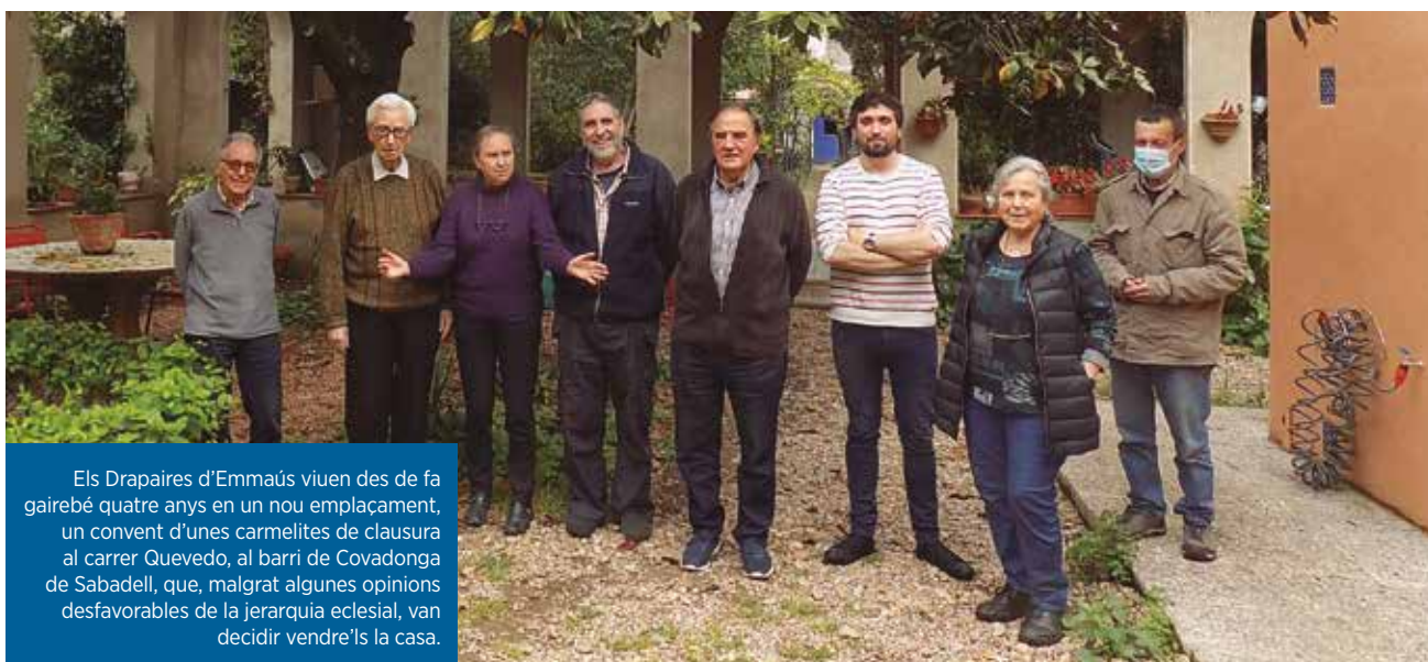
Els Drapaires d'Emmaús viuen des de fa gairebé quatre anys en un nou emplaçament, un convent d'unes carmelites de clausura al carrer Quevedo, al barri de Covadonga de Sabadell, que, malgrat algunes opinions desfavorables de la jerarquia eclesial, van decidir vendre'ls la casa.

L'altra pota dels Drapaires d'Emmaús és la Fundació que ha permès, d'una banda, «canalitzar la solidaritat i les ajudes a entitats del país i de fora (actualment, el