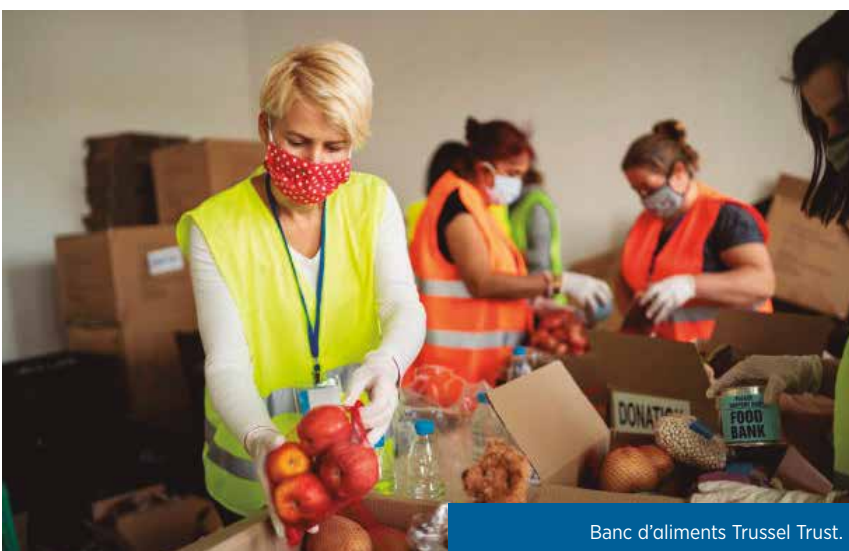
Banc d'aliments Trussel Trust.

«Collim el que sembrem» és una màxima bíblica molt coneguda. Des del punt de vista moral, pot usar-se per a referir-se al fet que, si ets bo, colliràs les recompenses de la bondat, o si ets dolent, tal vegada t'emportes el càstig de ser renyat i tractat amb severitat. No obstant això, en la nostra realitat, la pregunta que hem de plantejar-nos és: qui sembla i qui acaba collint? És una pregunta crucial en les nostres Revisions de Vida per a tractar d'entendre qui està realment fent la sembra, la seva filosofia i ideologia i el que això significa per als treballadors i per a les seves famílies.