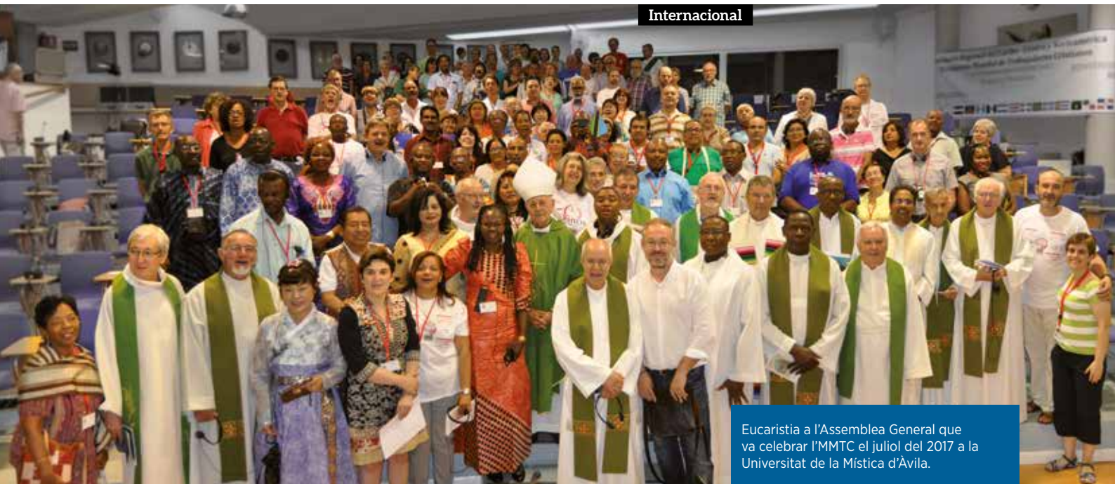
Eucaristia a l'Assemblea General que va celebrar l'MMTC el juliol del 2017 a la Universitat de la Mística d'Àvila.