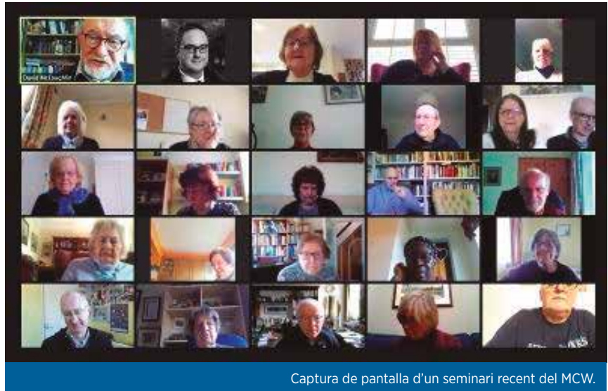
Captura de pantalla d'un seminari recent del MCW.

El paper de les dones destaca en els sectors de la sanitat i l'assistència social, ja siguin personal de cura o de neteja o empleades d'oficina i, per tant, treballadores clau i de primera línia durant la pandèmia. També ocupen la majoria de llocs de treball en el comerç minorista, l'hostaleria i l'oci, els sectors més afectats pel confinament i la desocupació. Són els mateixos treballs que s'associen en gran mesura amb salaris baixos i contractes precaris de zero hores. Una vegada més, solen ser les dones les que acaben tractant d'organitzar el pressupost familiar per a fer front a les despeses generals i alimentar la família. Els estudis indiquen que les dones BAME al Regne Unit estan soffrint més grans perjudicis econòmics perquè tenen més probabilitats de tenir una feina a temps parcial, de ser acomiadades o de perdre la feina. L'educació dins la llar també s'ha convertit en una altra atenció que se suma a les necessitats de la llar i és més probable que sigui duta a terme per les dones.